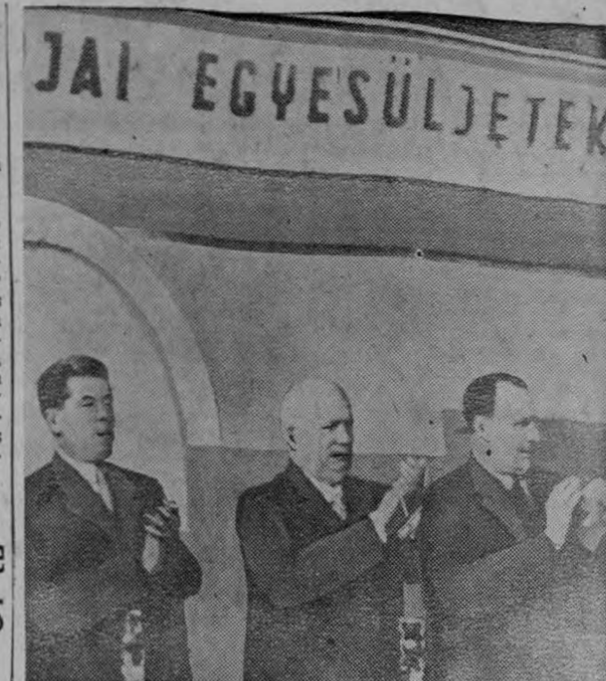
LA MANO SOVIETICA EN HUNGRIA.—El Premier soviético Nikita Krushev aplaude junto al Ministro de Estado de Hungría, Gyorgy Marosan (izquierda) y Janos Kadar, presidente del Partido Comunista Húngaro. Ellos estaban celebrando la inauguración en Budapest del séptimo congreso del partido Laboral Húngaro.